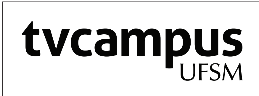
Versão monocromática positiva