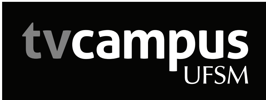
Versão escala de cinza negativa