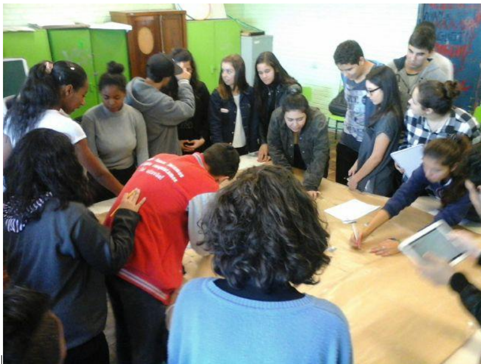
Figura 2: Discentes da escola produzindo mapa.

onde os discentes da disciplina Arte e Mídia II aos poucos foram armazenando o conteúdo produzido.