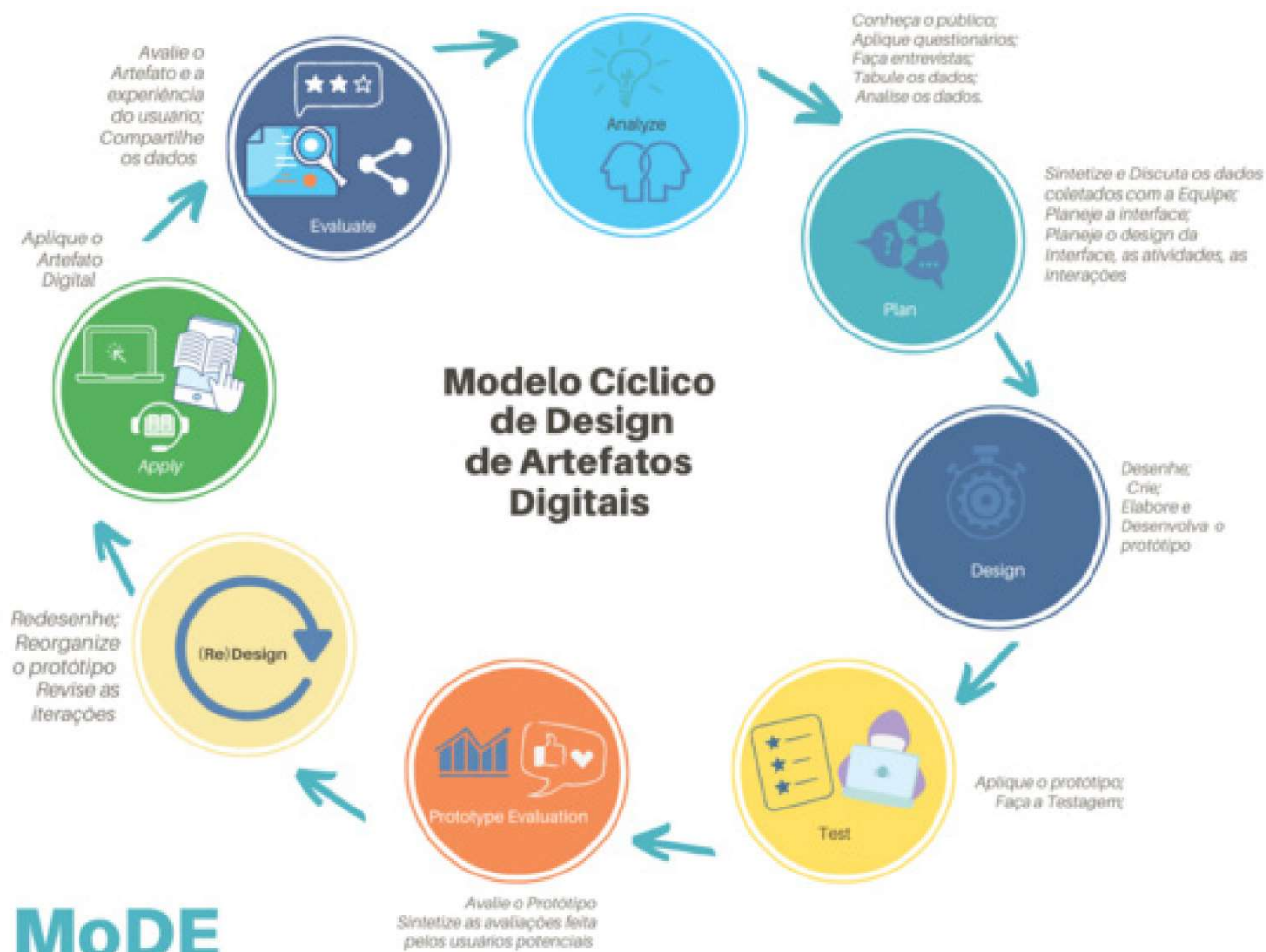
Figura 2, fonte: reis 2021

A utilização do framework MoDE dá-se no processo de elaboração de materiais didáticos digitais, que compreende 8 passos: Análise, Planejamento, Design, Testagem, Avaliação do Protótipo, (Re) Design, Aplicação, Avaliação; que ocorrem de maneira cíclica. (REIS, 2021). Como ilustrado pela figura 2.