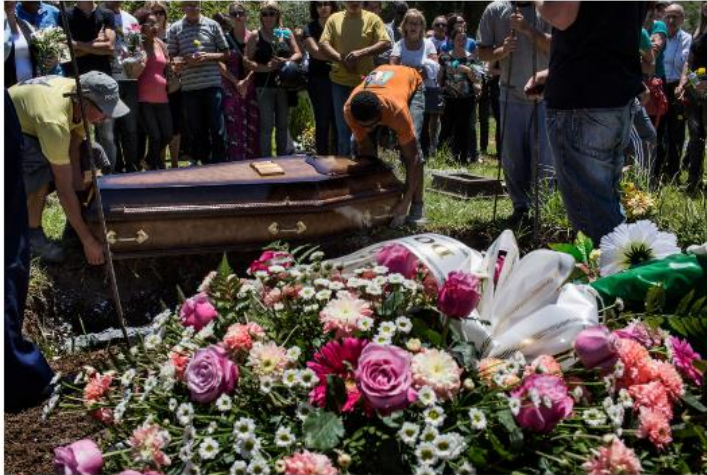
A victim of a nightclub fire that left more than 230 dead in Santa Maria, Brazil, was buried on Monday. The city seemed to be in shock after the blaze.