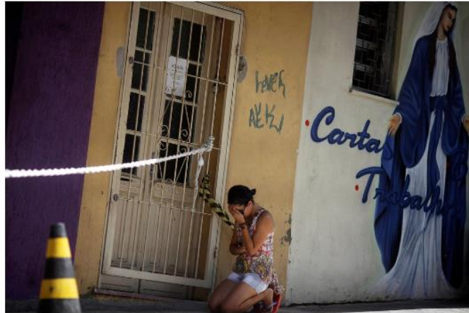
A woman outside the club in Santa Maria where a fire killed more than 230 people on Sunday.

SANTA MARIA, Brazil — First there was the shock over the chaotic nightclub fire here that killed more than 230 people, many of them promising university students. Then there was the grief as families began burying their dead.