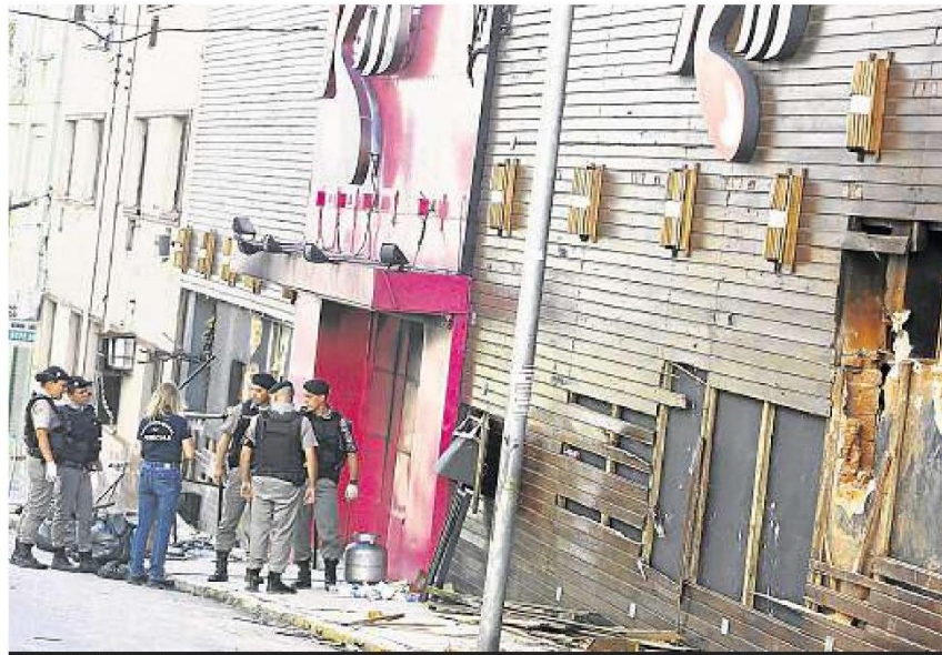
Com apenas uma porta para entrada e saída, fachada da boate teve buracos abertos para facilitar o resgate de vítimas

ADRIANA IRION, FRANCISCO AMORIM e JOANA COLUSSI