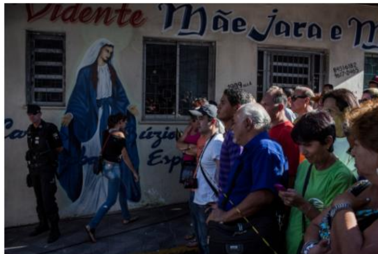
People gathered by the nightclub, Kiss, which caught fire Sunday. Many of those who died, from asphyxiation and burns, were university students.

Those who survived did so after a group of patrons overpowered security guards, who initially kept people from fleeing out of concern that they were trying to leave without paying their tabs. By the time it became obvious that was not the case, the clubgoers inside had begun to die, largely from asphyxiation.