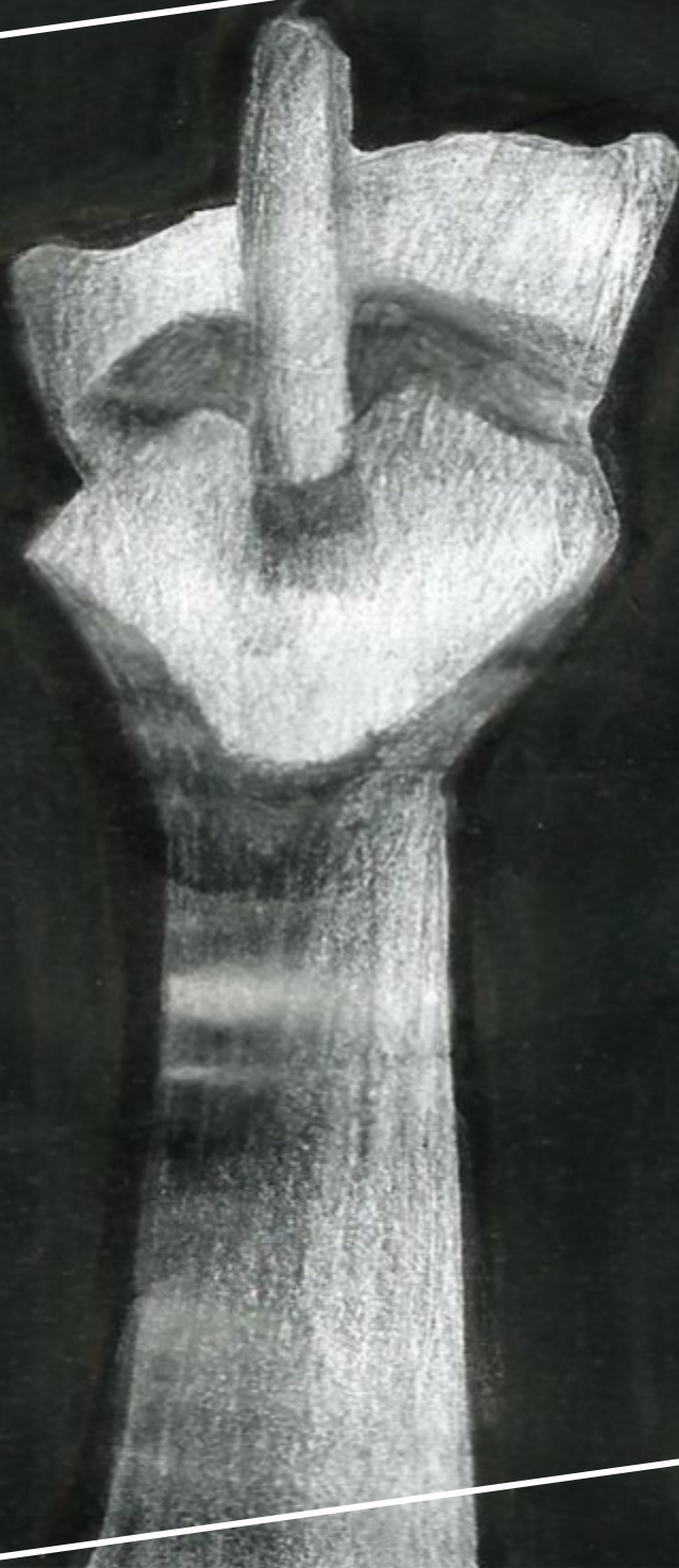
Obra: Anderson Técnica: Cimento Ilustração: Vinícius Cureau, acadêmico do Curso de Artes Visuais