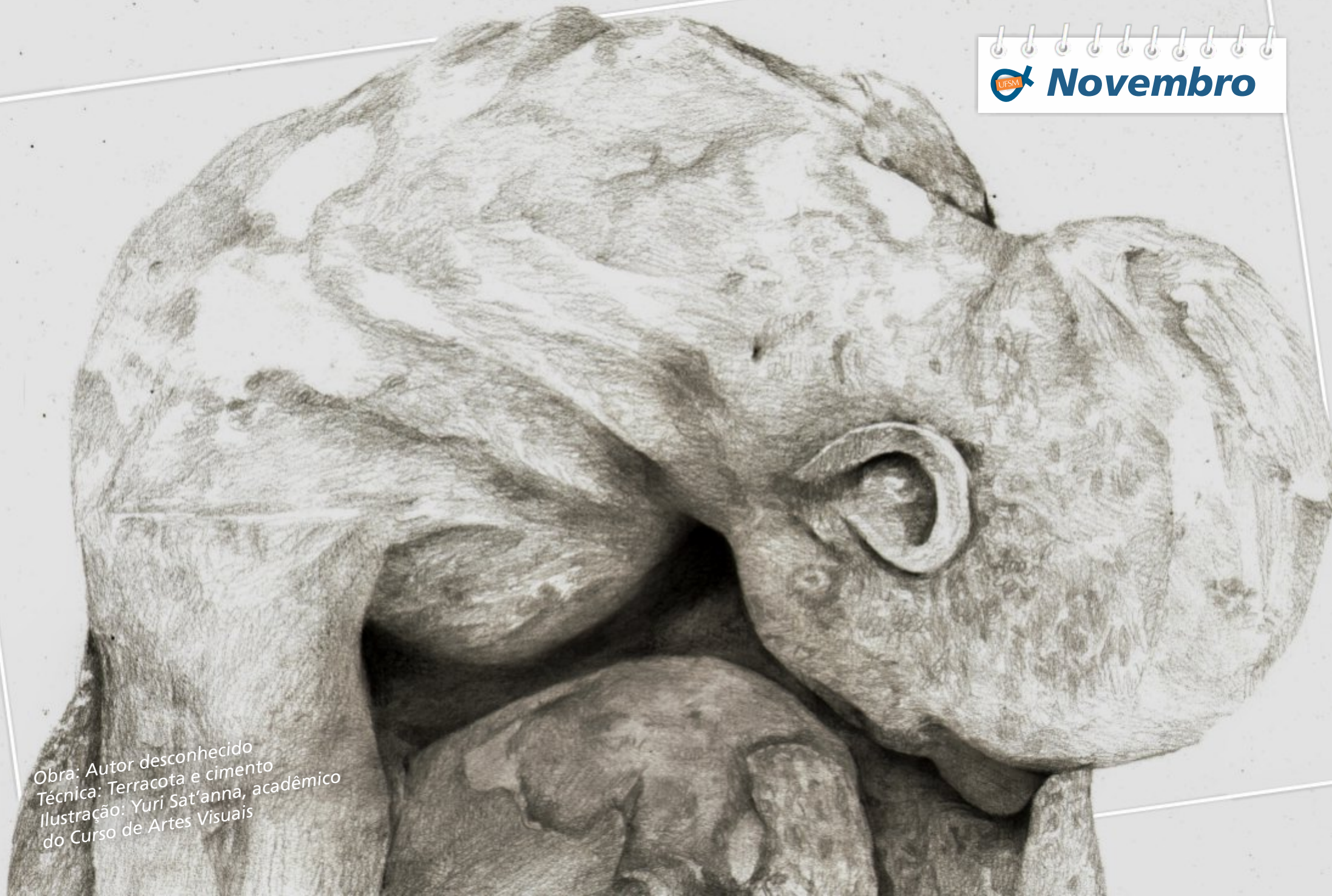
Obra: Autor desconhecido Técnica: Terracota e cimento Ilustração: Yuri Sat'anna, acadêmico do Curso de Artes Visuais