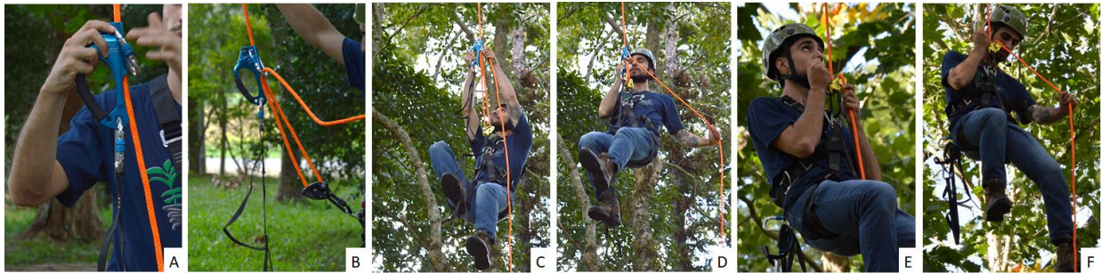
Figura 3 – Instalação dos equipamentos, ascensão e descida por rapel

Na outra ponta da corda o escalador deve instalar os equipamentos e realizar os movimentos de ascensão. Para descida o escalador deve remover os equipamentos de ascensão e liberar a alavanca do descensor (Figura 3).