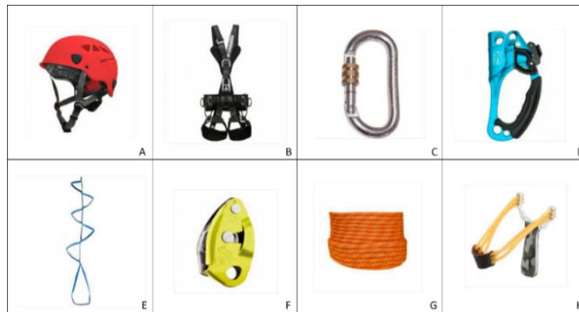
Figura 1 – Equipamentos para escala de árvores