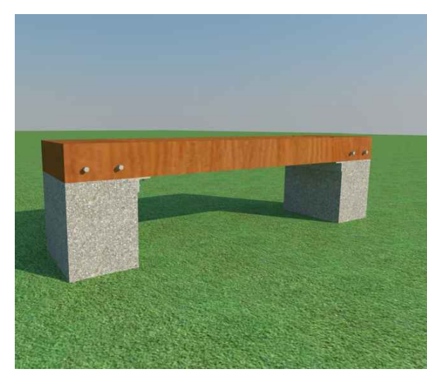
Vista inferior - detalhe das cantoneiras Sem escala