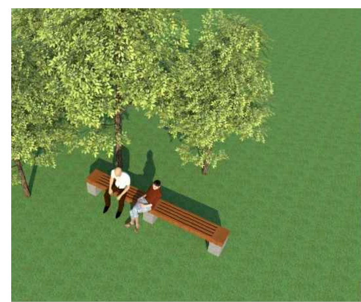
Vista geral - sem escala