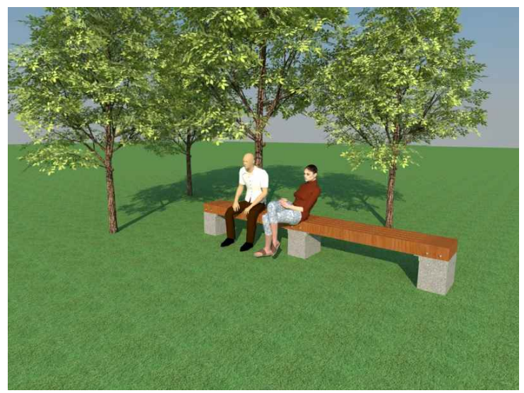
Vista geral - sem escala