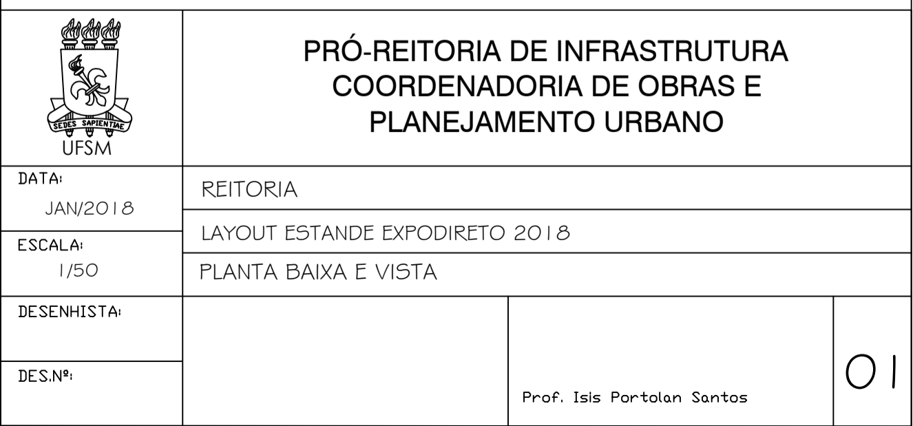
PLANTA BAIXA COM LAY-OUT

UFSM Objeto: ESTANDE Local: Parque de Exposições - Não-me-Toque/RS. Evento: EXPODIRETO 2018