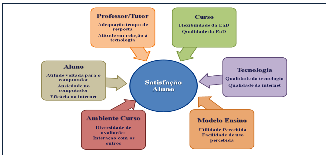
Figura 1 - Dimensões e antecedentes da percepção de satisfação EaD

O modelo usado no estudo de caso (Figura 1) foi desenvolvido por Sun et al. (2008) e apresenta como diferencial o fato de reunir, em uma única abordagem, distintas vertentes teóricas importantes para a compreensão do construto.