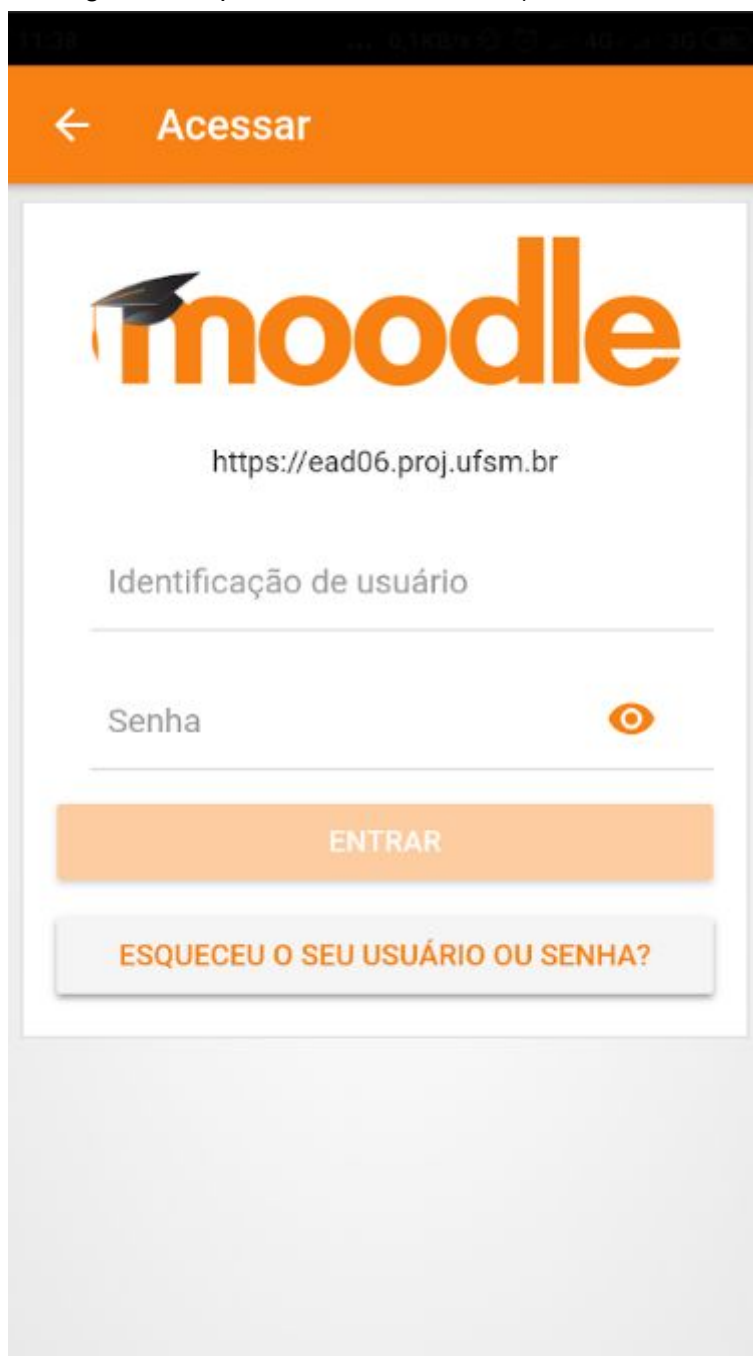
Figura 3: Tela do aplicativo após ter informado o endereço do ambiente

3) Depois de preenchido e apertado o botão 'Conectar!' teremos a tela abaixo, onde deve entrar com o mesmo login usado para entrar no Moodle (matrícula, CPF ou Siape)