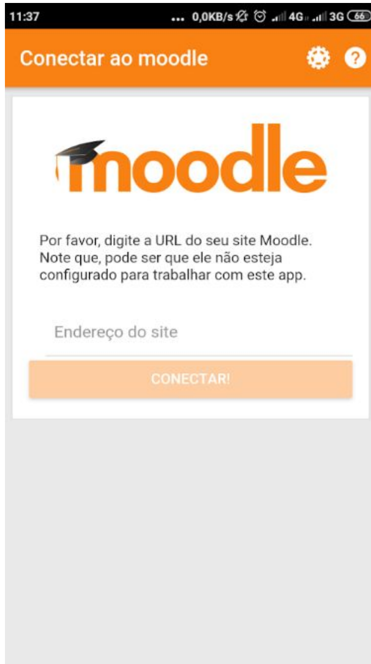
Figura 2: Tela inicial do aplicativo Moodle