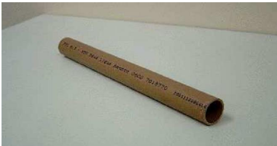
Figura 4. Exemplo de tubo de PVC para água fria de 1/2" de diâmetro