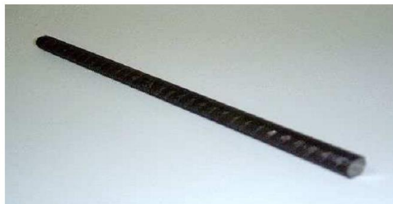
Figura 6. Exemplo de barra de aço para a aplicação da carga de teste.