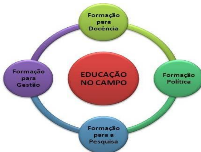
Figura 1: Relação entre o eixo norteador e os eixos articuladores

O eixo norteador do curso, Educação no Campo, visa responder ao desafio da complexidade do seu próprio objeto de estudo, ou seja, a necessidade de encontrar indicativos conceituais e metodológicos para oferecer formação docente contextualizada e consistente. Dessa forma, tornando-se um sujeito capaz de estar a frente das transformações político-pedagógicas necessárias na rede de escolas que hoje atendem a população que trabalha e vive no e do campo.