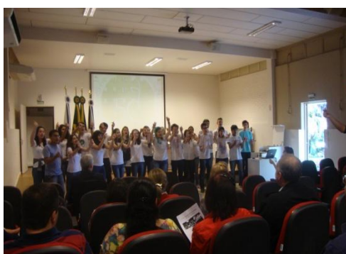
Apresentação Grupo: Recital de Conclusão