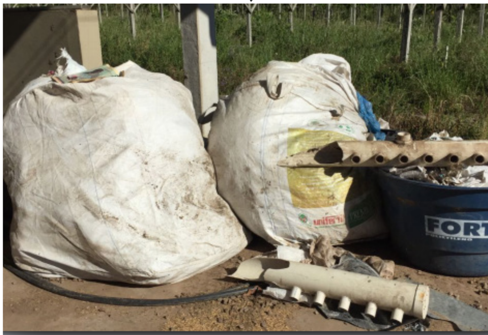
Retirada de rejeitos do galpão da compostagem.