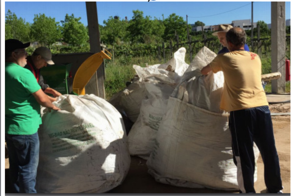
Retirada de rejeitos do galpão da compostagem.