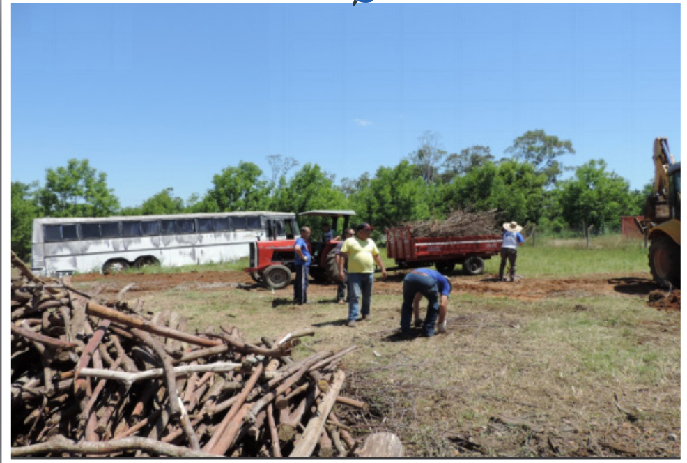
Organização da lenha da caldeira.