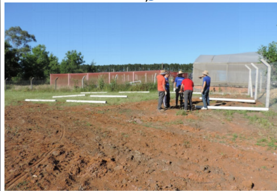
Grupo discutindo detalhes do planejamento para colocação do sombrite.