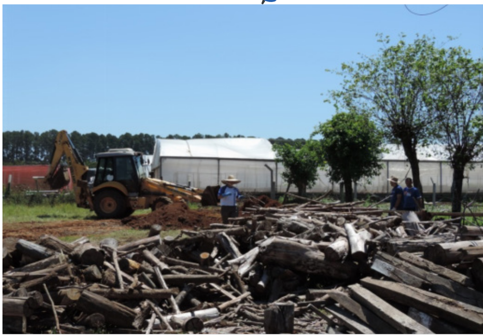
Organização da lenha da caldeira.