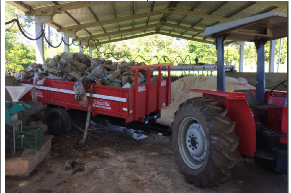
Retirada de rejeitos do galpão da compostagem.