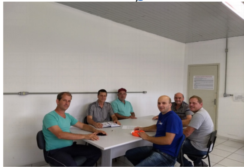
O grupo organizando as atividades em reunião.