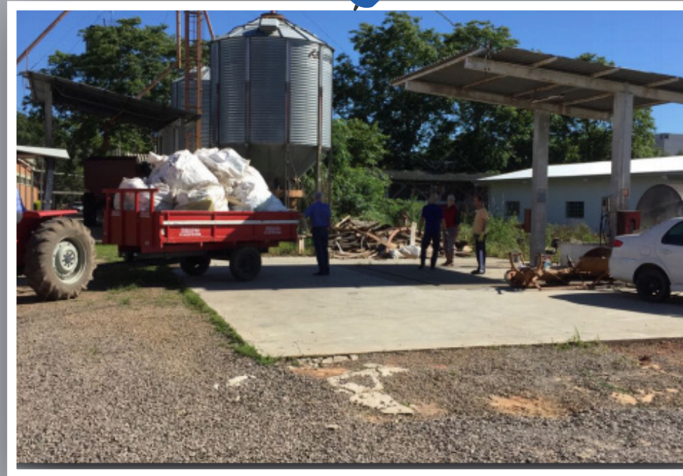
Retirada de rejeitos do setor de energias renováveis.