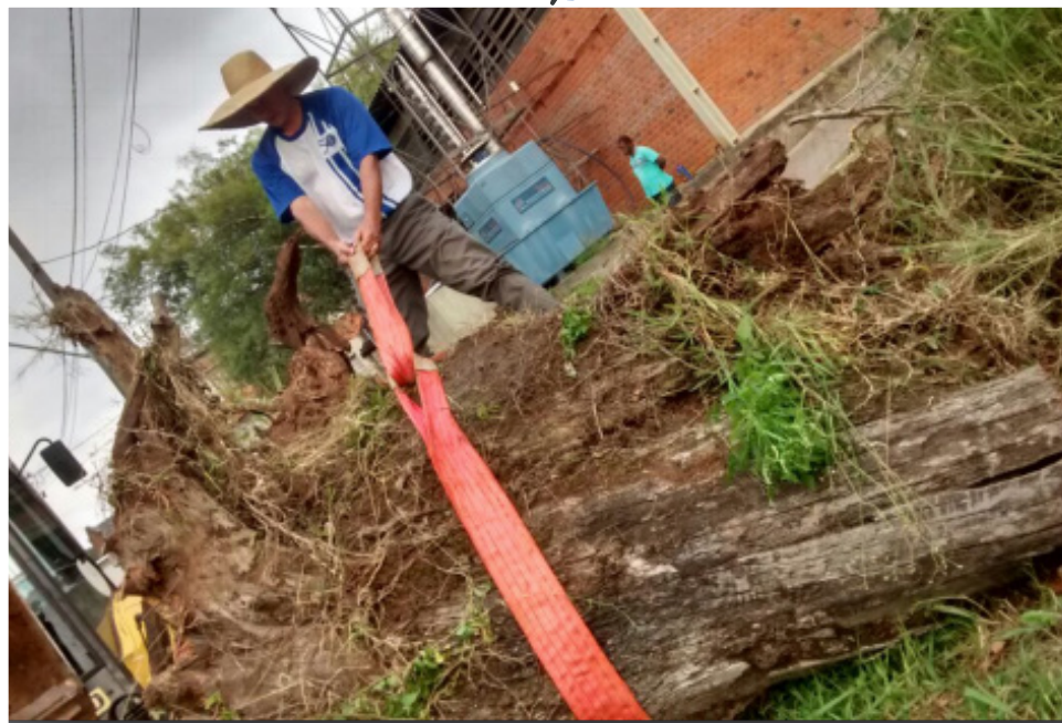
Retirada do toco de eucalipto da frente da usina de etanol.