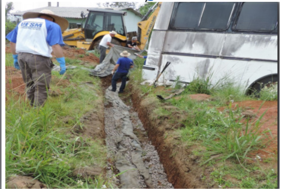
Colocação de dreno no setor de frutíferas nativas.