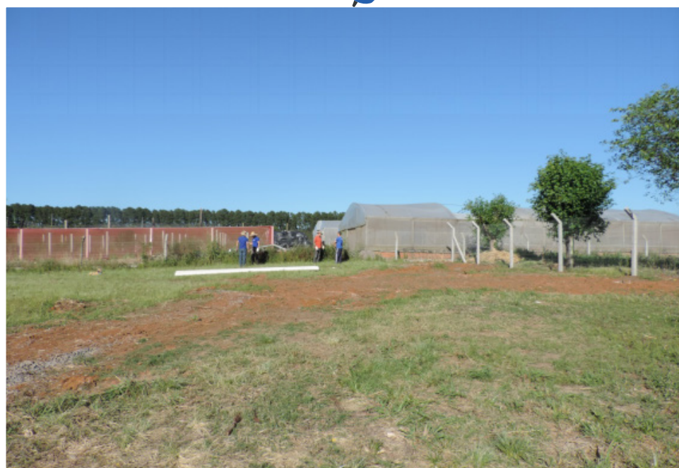
Organização do setor de frutíferas nativas.