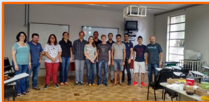
Foto do grupo em atividade de encerramento das atividades no ano de 2016.