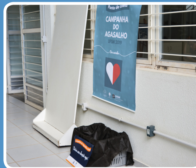
Ponto de coleta da Campanha do Agasalho no Bloco F do Colégio Politécnico.

sede da UFSM, também podem ser feitas doações no Centro de Educação, Centro de Tecnologia, Centro de Artes e Letras, Centro de Ciências da Saúde, Centro de Ciências Rurais, Centro de Ciências Naturais e Exatas, Centro de Ciências Sociais e Humanas, Centro de Educação Física e Desporto, Hospital Universitário, Colégio Técnico Industrial de Santa Maria, Reitoria ou na Unidade de Educação Infantil Ipê Amarelo.