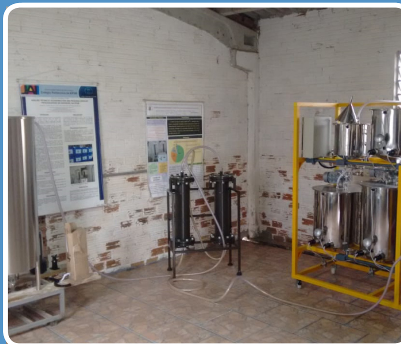
Usina de biodiesel em fase de testes.