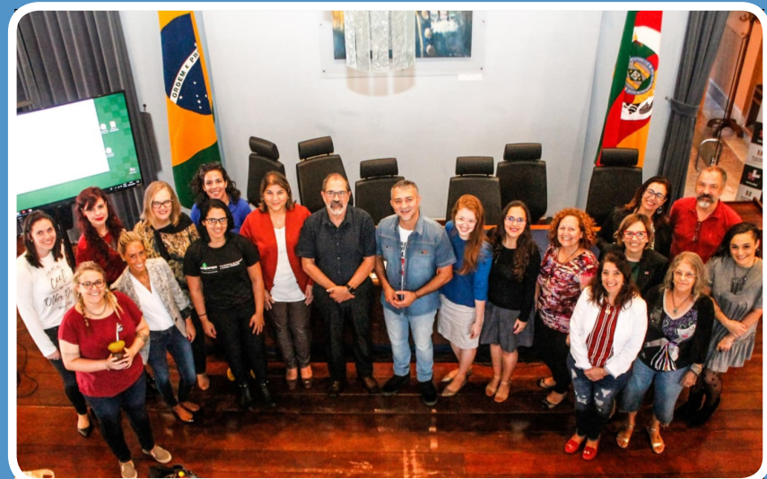
Texto e imagens: Laura Ferreira Cortes.