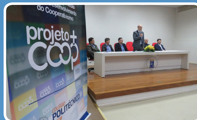
Relato e imagens: Projeto +Coop.